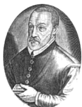
Blaise de Vigenère (1523-1596)

Modifiez le programme de l'exercice 8.3 pour crypter et décrypter des messages avec le chiffre de Vigenère.