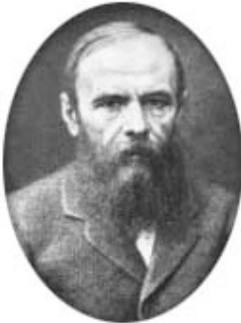
Fédor Mikhaïlovitch Dostoïevski (1821-1881)